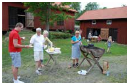
Hembygdsgården Berget, med en aktiv hembygdsförening.