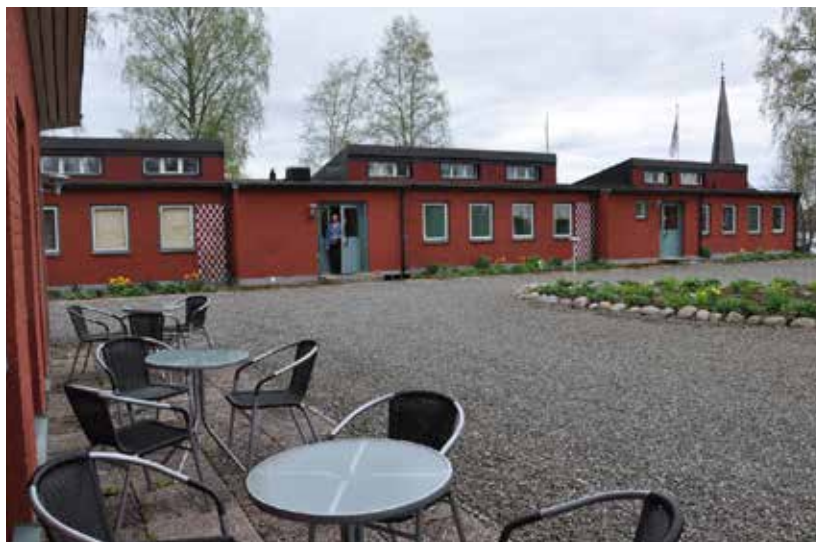
Baksidan av hotellanläggningen.