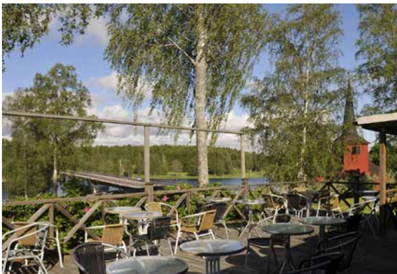
Utsikt mot Lungsunds kyrka från uteserveringen.