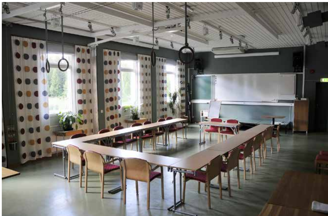
Hotellet är en ombyggd skola där den gamla gymnastiksalen fick bli en modern konferenssal. Det finns även två mindre konferenssalar.