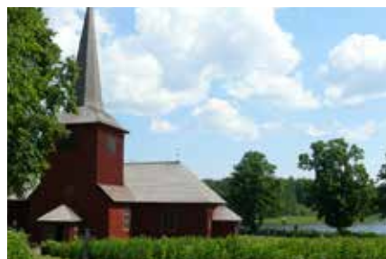
Lungsunds kyrka - omtyckt dop- och vigselkyrka. Aktiv församling.