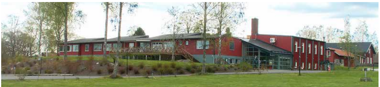
Ovan; utsikt från uteserveringen över campingplatsen. Underst; Framsidan av hotellbyggnaden.