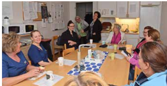
Morgonmöte i hemtjänsten. Det finns gott om personal som har glimten i ögat.

löser alla problem. Vi är helt suveräna på det och den kamratskapen skapar en väldigt god stämning, säger hon,