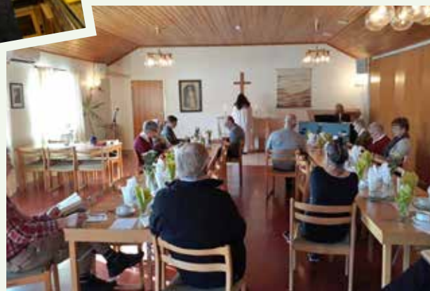
Ankargudstjänst med kyrkbacksträffens deltagare i Bjurtjärns församlingshem följdes av en god sopplunch.