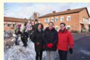
Personal och rektor på Bjurtjärns skola.