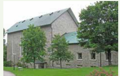
Storfors kyrka fyller 60 år.

Den här dagen har du också möjlighet att se på många av kyrkans föremål som är skänkta av församlingsbor.