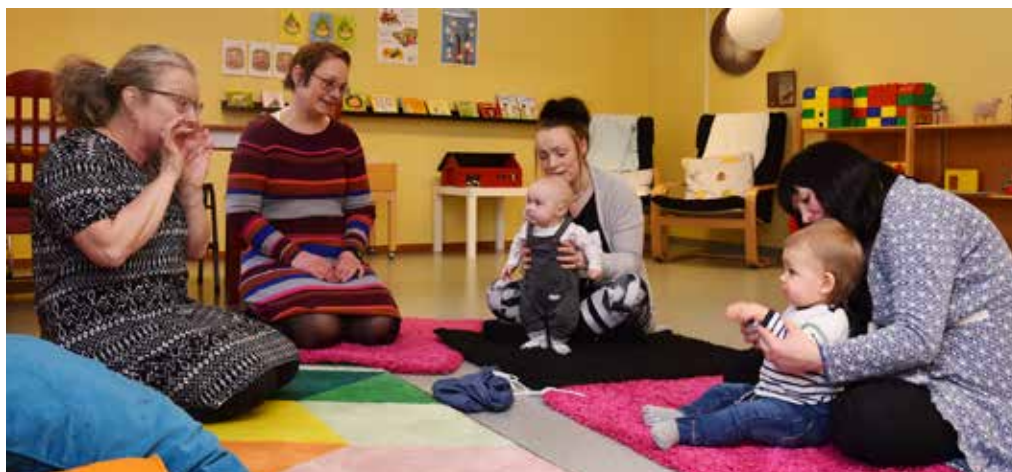
Sångstunden på Öppna förskolan är populär.

- Jag stortrivs verkligen med det. Här får man träffa både föräldrar och barn under trevliga former. Jag vill ju vara en resurs för den som