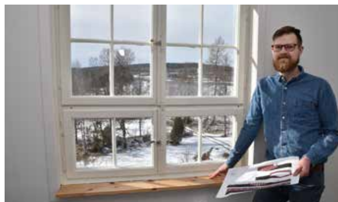
Hemmakontoret bjuder på grym utsikt över Storfors.

flyttade från Karlskoga till Storfors och hustrun Elin fick jobb som sjuksköterska i närområdet kändes tiden mogen.