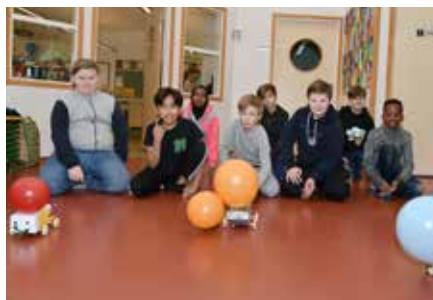
Några av femteklassarna testar sina bilar under teknikdagen.