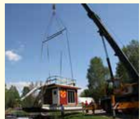
Den nya flotten lyftes i efter återuppbyggnaden.