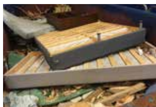
Sängar och dynor har hamnat i containern för trä.

Just nu gäller självbetjäning varje vardag klockan 07.00 till 18.00 på Återvinningscentralen, men försöket får inte innebära alltför