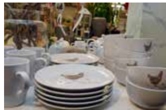
Vårblommor och lökar trängs med porslin, kurkor och "roliga saker" i butiken i Storfors.