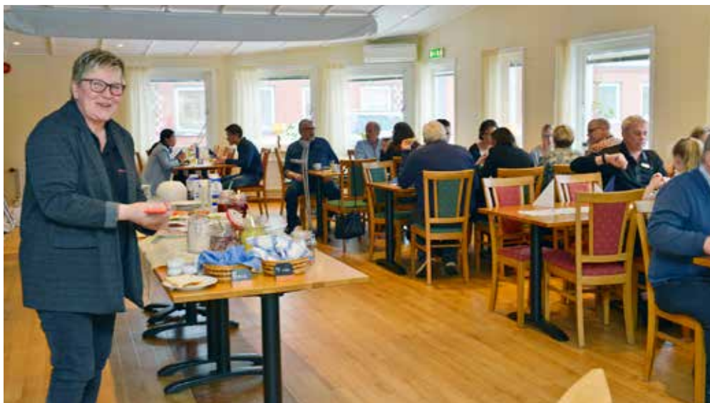
Dryga 20-talet företagare hade samlats på Pensionat Lungsund.