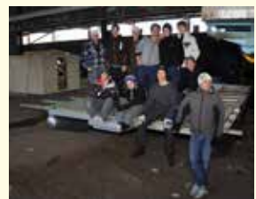
Första bygget av flotten.

● Frågor om bokning eller annat som gäller bastuflotten kan ställas via mail till storfors.forsamling@svenskakyrkan.se eller via telefon 0550-600 42 vardagar kl 10-12.