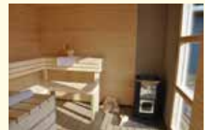
Ljust och rymligt i basturummet.