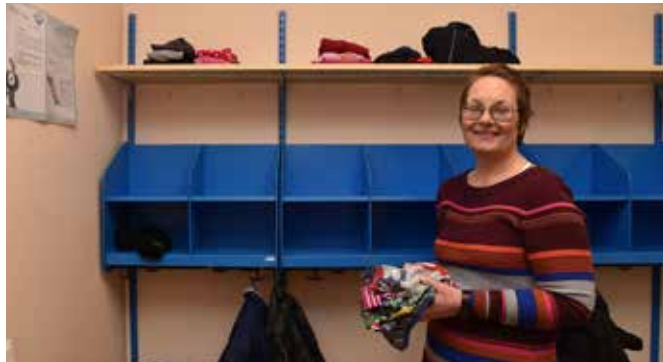
TAGE-hyllan ska fyllas med urväxta kläder.