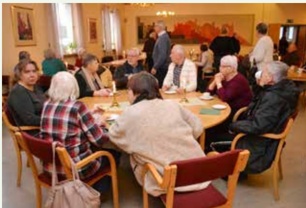
Trivsel vid kaffeborden efter ankargudstjänsten.

Som t.ex när vi har Gudstjänst med små och stora, så är det barnverksamheten som har varit med och jobbat för gudstjänstens utformning. För någon vecka sedan var det Storforsträffens deltagare som tagit hjälp av Storfors dragspelsklubb för att vara med och välja psalmer och sånger och spela till dem alla i kyrkan. I Bjurtjärn var det Kyrkbacksträffens deltagare som valde psalmerna, läste texter och önskade vad som skulle tas med i kyrkans förbön. Alltså ett sätt att aktivera fler människor i våra gudstjänster. Innan nästa nummer av Kanalen kommer ut har även Våga prova-gruppen ansvarat för en gudstjänst. Den är placerad på en torsdagskväll. Kom gärna med dina tankar och idéer för gudstjänster och vårt arbete i stort.