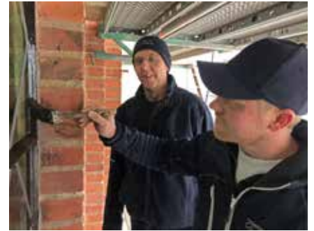
Fönstren plockas ut för att saneras i boden och målas sedan på plats.