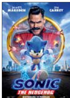
Sonic the hedgehog 19/2 kl 18 samt 25/2 kl 15, 80 kr

Centrumplan 1. Kassa & kiosk öppnar 30 min före föreställningen. Endast kontant eller swish. Senaste bioprogrammet: bioguiden.se