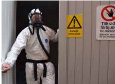
...en sluten station för asbestsanering.