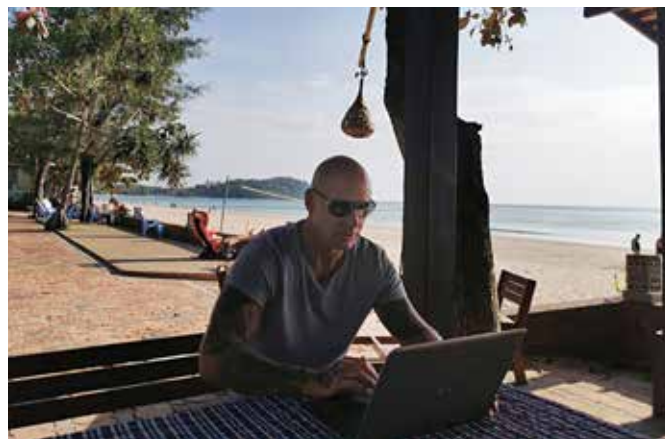
En vanlig förmiddag på "kontoret".