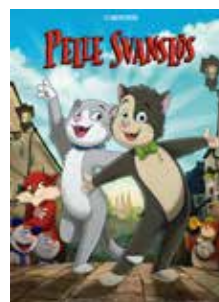
Pelle Svanslös 27/2 kl 15, 80 kr

Fler filmer kommer självklart under mars och april. Håll utkik på bioguiden. se