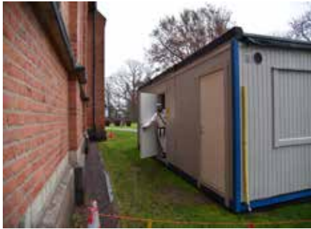
En byggbod har förvandlats till...