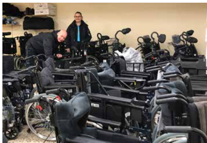
Det finns många olika sorters rullstolar att prova.