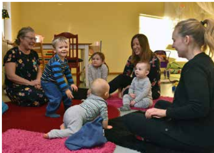
Sångstunden är alltid populär och barnen får välja sånger med hjälp av inplastade bilder i en spännande påse.

Ofta har Öppna förskolans personal en samling eller en sångstund och just idag får