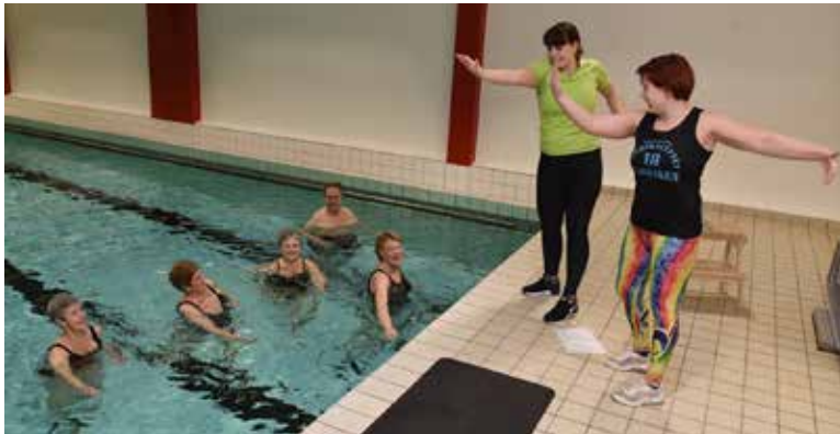
Glada deltagare i vattenmotionsgruppen.