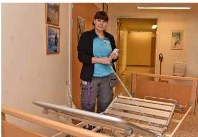
En säng väger 100 kilo och behöver transporteras av två personer.