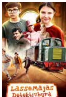
Lassemajas Detektivbyrå - Tåggränarens hemlighet 26/2 kl 15, 80 kr