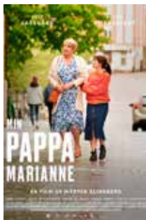
Min pappa Marianne 21/2 kl 18, 100 kr