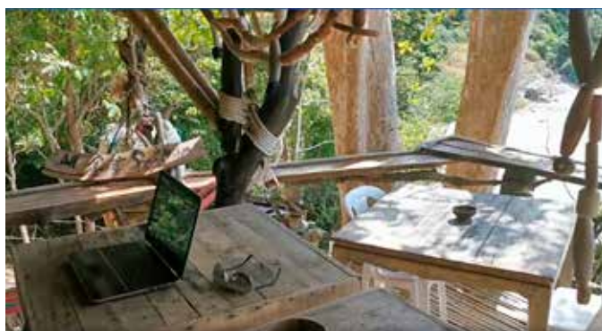
Kontoret i Thailand är minst sagt luftigt och inspirerande.....