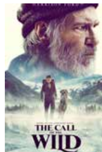
The Call of the Wild - Skriet från vildmarken 26/2 kl 18, 80 kr