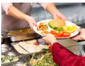
Ett förslag är att se över möjligheten att överbliven mat från exempelvis skolan kan säljas som matlådor till elever och personal.

Genom att avfallsplanen uppdateras och samordnas för Storfors och Karlskoga kommuner kommer arbetet att bli effektivare.