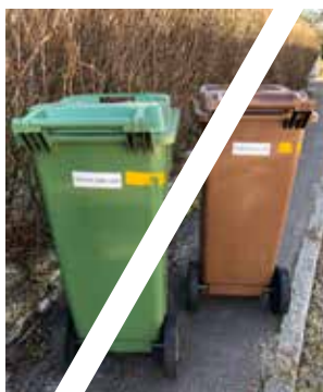
Delad tunna med grannen ger redan idag mer än halverad årsavgift. Målet är att fler nu ska utnyttja detta.