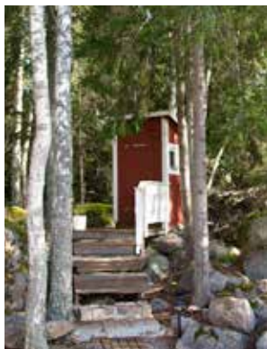
Latrin ska helst tas om hand på den plats där det uppstår.