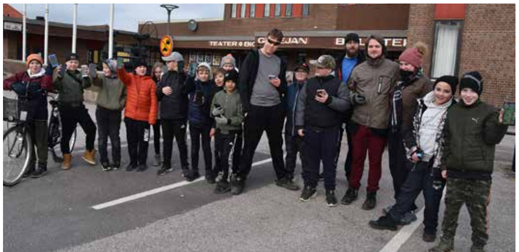
20-talet barn hade slutit upp för att jaga Pokemon digitalt med hjälp av en app.

- Det här bidrar ju verkligen till folkhälsan. Ungdomarna är både svettiga och glada efter att ha rört sig i ett par timmar, säger hon.