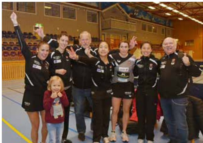
Storfors BTK hade fullt lag inför slutspelet. Även om klubben självklart står bakom beslutet att ställa in slutspelet är besvikelsen stor att man inte fick fajtats om guldhattarna.

- Därför känns det naturligtvis tråkigt att vi inte får visa det i ett slutspel.