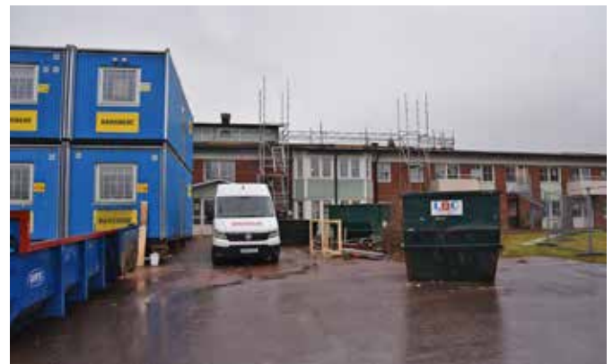
Arbetet pågår för fullt inne i huset. Utsidan ska senare få liknande utformning som Sjögläntans boende tvärs över vägen.

I slutet av augusti eller under september räknar man med att flytten ska gå från Smedens särskilda boende, som idag ligger i Hälsans Hus