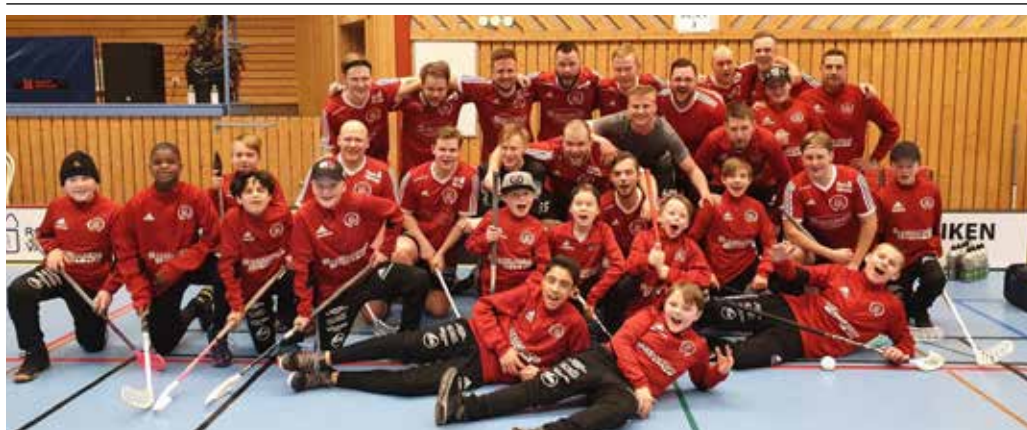
Spelarna i Storfors IBF är överväldigade av responsen.