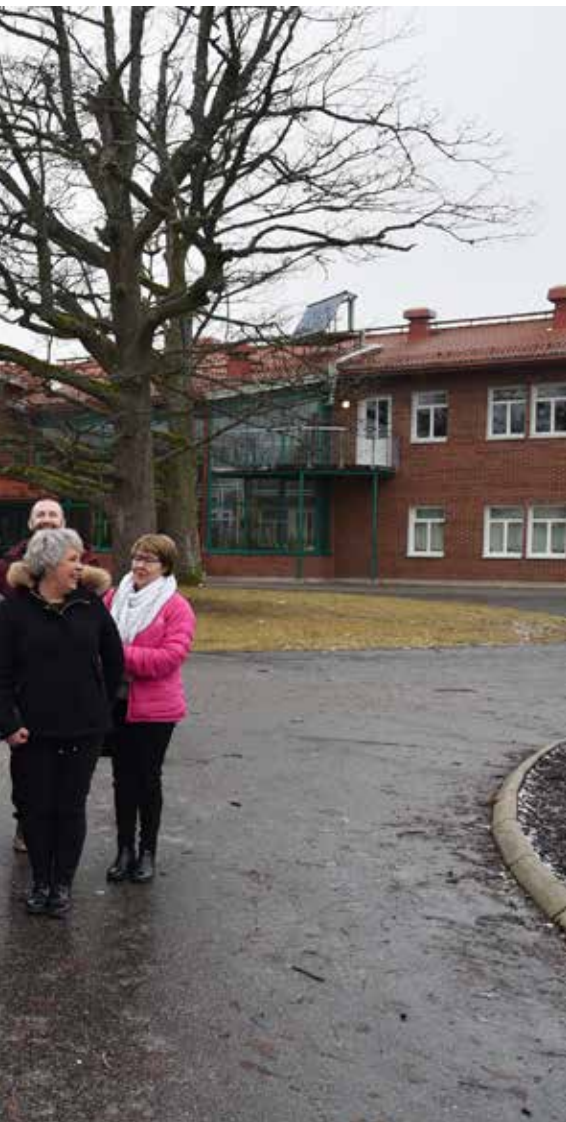
...mland för att ta reda på varför skolorna i Storfors