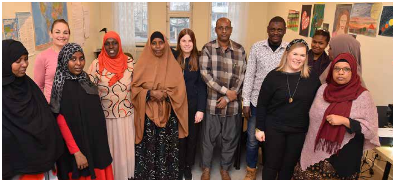
Gruppen har varit både diskussionsvillig och trogen att komma till träffarna.