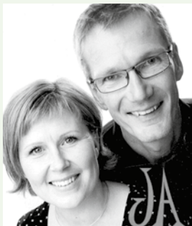
Sångduon JA medverkar vid församlingens vårkonsert som hålls den 17 maj i Storfors kyrka.