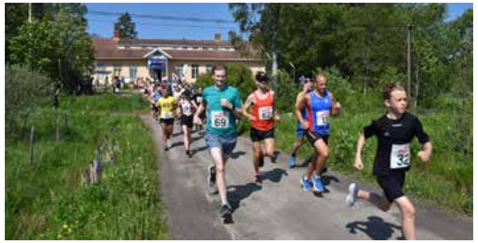
Förra årets Bjurtjärnslopp blev som vanligt en folkfest.

- Självklart vill vi gärna testa den, det blir en anledning att komma tillbaka, säger han. EVA WIKLUND