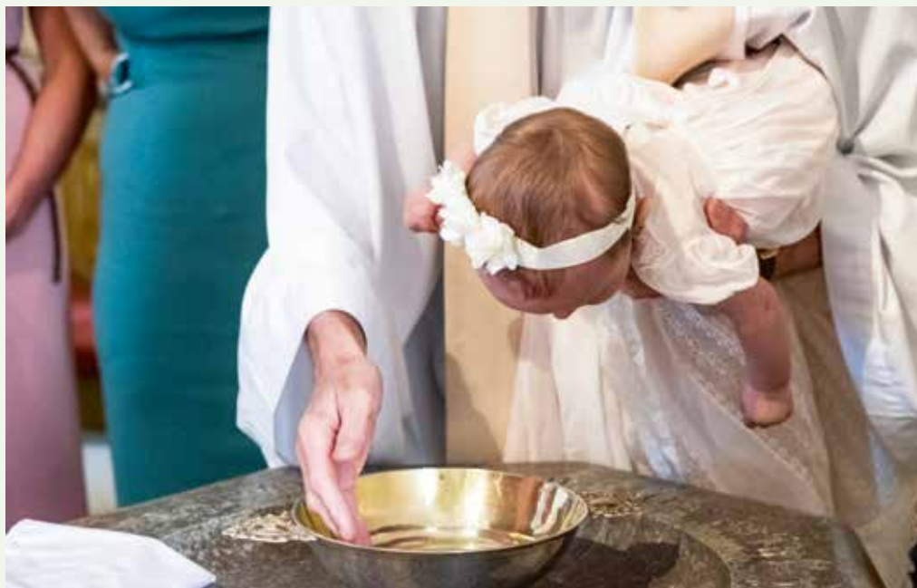
Man kan likna dopet vid en gåva som föräldrarna ger sitt barn.

Det är inte bara barn som kan döpas, åldern spelar ingen roll. När det gäller små barn och ungdomar är det vårdnadshavarna som bestämmer. Om barnet är tolv år