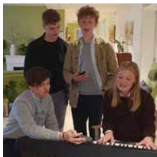
Det blev mycket sång och musik.

Kulturverksamheten på Lundsbergs skola är bred och eleverna kom med både instrument och en vilja att un-