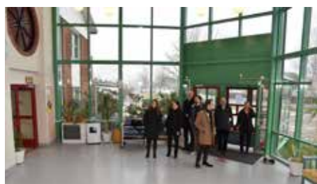
Besökarna beundrar Kroppaskolans luftiga entréhall.