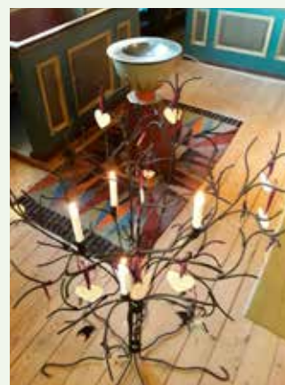
Dophjärtan i Lungsunds kyrka.

En del saker som kyrkan gör och medverkar till syns