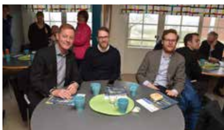
Studiebesöksdagen inleddes i Sporthallens cafeteria.