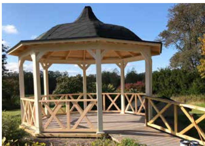
Paviljongen i Bjurtjärn - ett vackert smycke i rofyllda omgivningar.