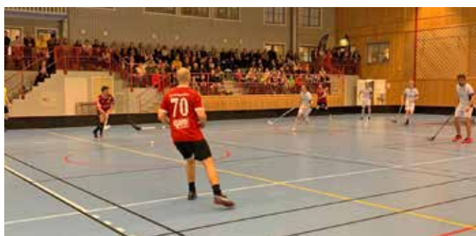
Fullt på läkarna och fullt ös under matchen mot Karlskoga.

- Sen har vi ytterligare bonusar som trillar in så vi tippar det hamnar runt 55 000