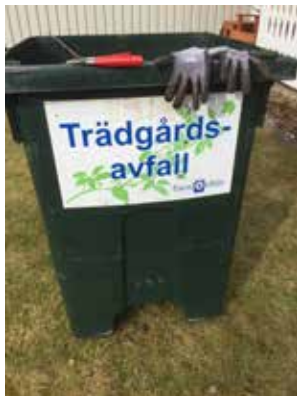
Hämtning av trädgårdsavfall i säckar föreslås upphöra, men man kan boka en tunna för trädgårdsavfall under säsongen.