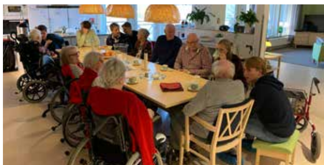
Ungdomarna från Lundsbergs skola tog gott om tid på sig för att hinna umgås med de äldre.