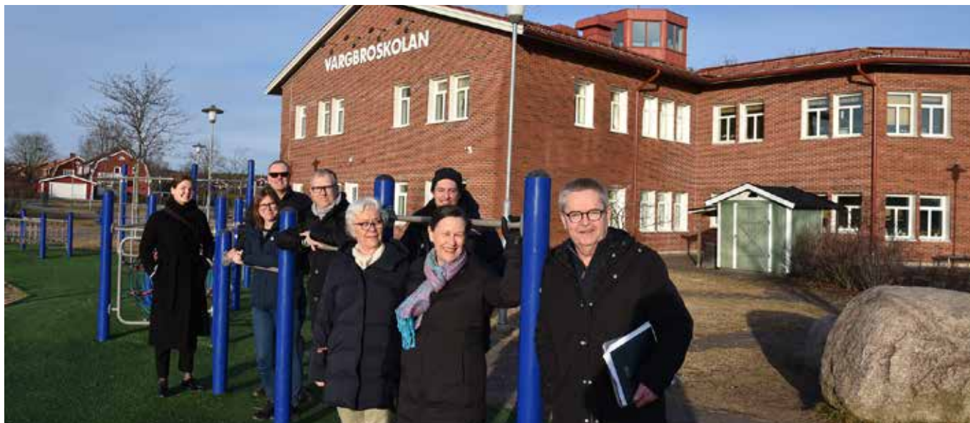
Politiker från Solna besökte både Torsby och Storfors för att hitta inspiration till skolförbättring på hemmaplan.