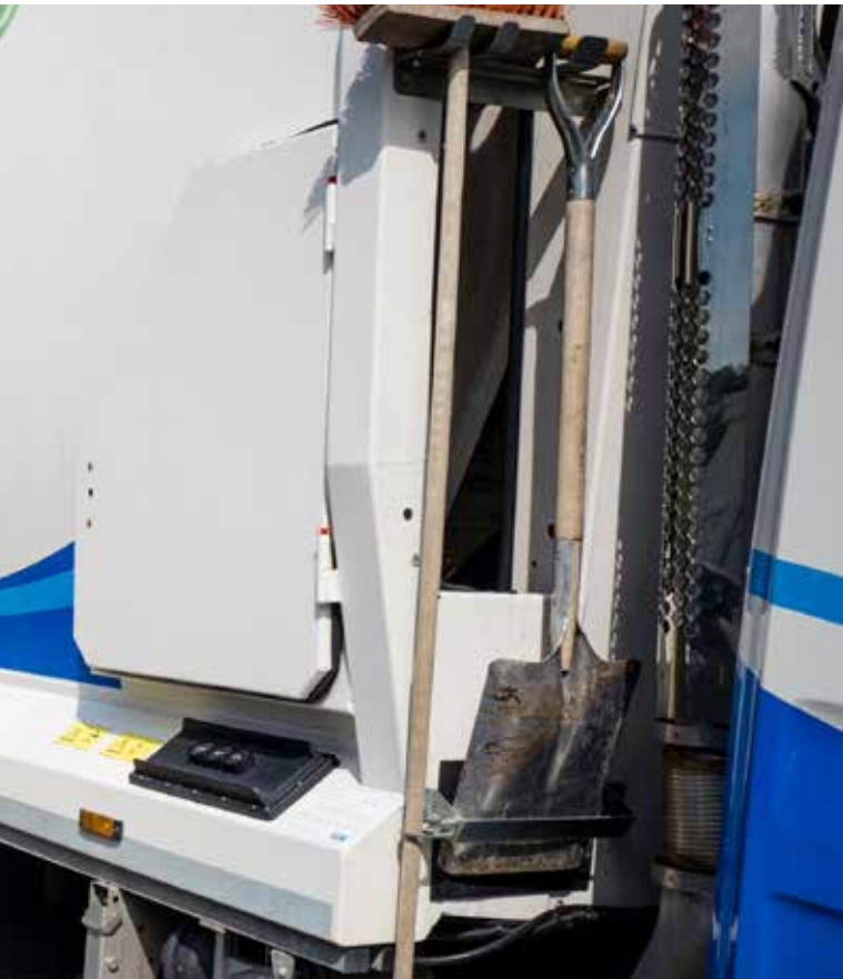
exempelvis var fjärde vecka eller varannan månad.