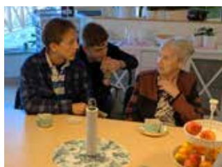
Fikat tillsammans och pratstunderna blev också mycket uppskattade.

derhålla. Tillsammans bjöde de på en trevlig musikalisk stund, men i projektet ingår också att ta sig tid till samtal och fika med de äldre.