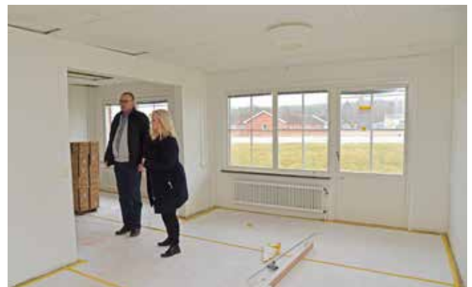
Lägenheterna blir stora, de flesta med uteplats eller balkong.