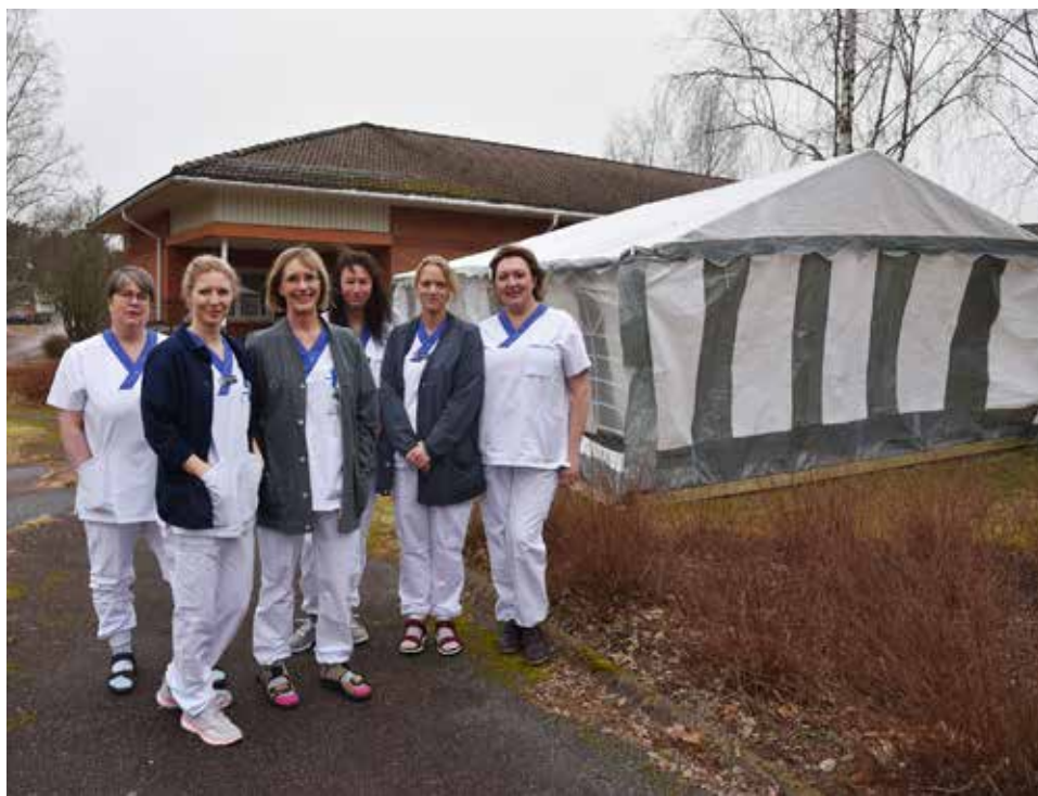
Förkylda patienter undersöks först i ett tält på baksidan av vårdcentralen.