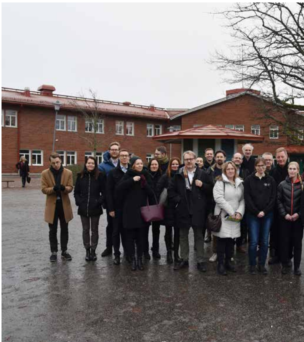
20-talet tjänstepersoner från skolenheten på utbildningsdepartementet spenderade två dagar i Väddö lyckas så bra, trots att det handlar om små enheter i pendlingsområden.