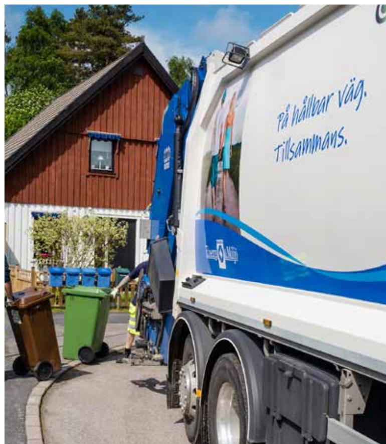
I den nya avfallsplanen föreslås att man ska kunna få flexibel sophämtning,

Istället kan man boka en tunna på 370 liter under hela säsongen för bara 750 kronor. Tunnan kan självfallet delas