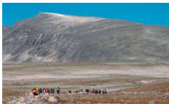
I Dovre får eleverna testa både tuffa, jobbiga och spännande aktiviteter. Det handlar om att utmana sig själv och att hjälpas åt i grupp.